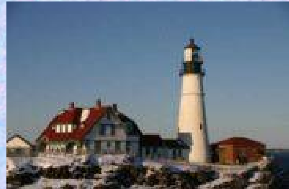
Portland Head Light Station, USA