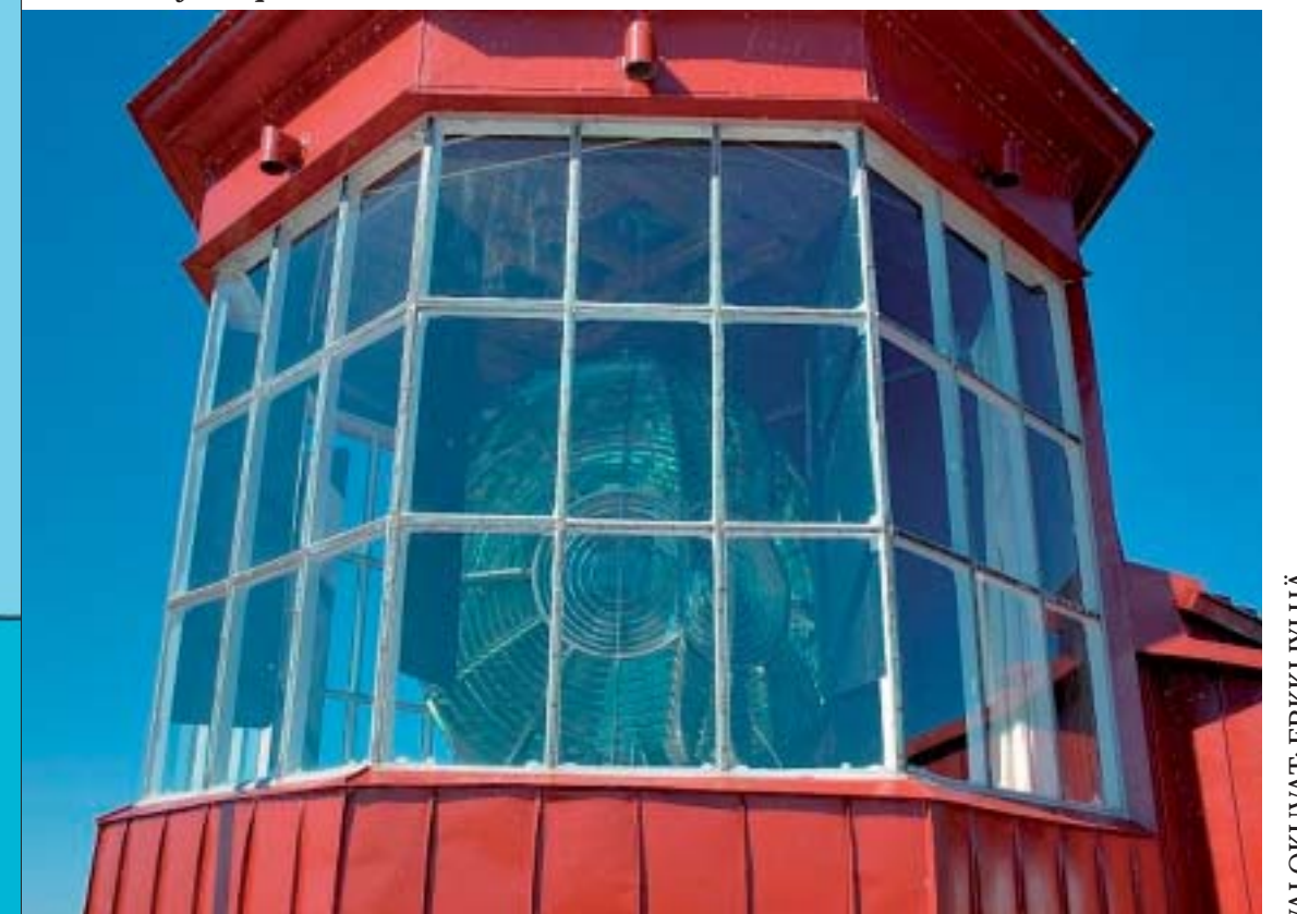
Handslipade kristallprisman anlände till Utö 1906 från Paris. Käsinhiotut kristalliprismat saapuivat Utöön Pariisista vuonna 1906. The crystal prisms arrived to Utö from Paris in 1906.