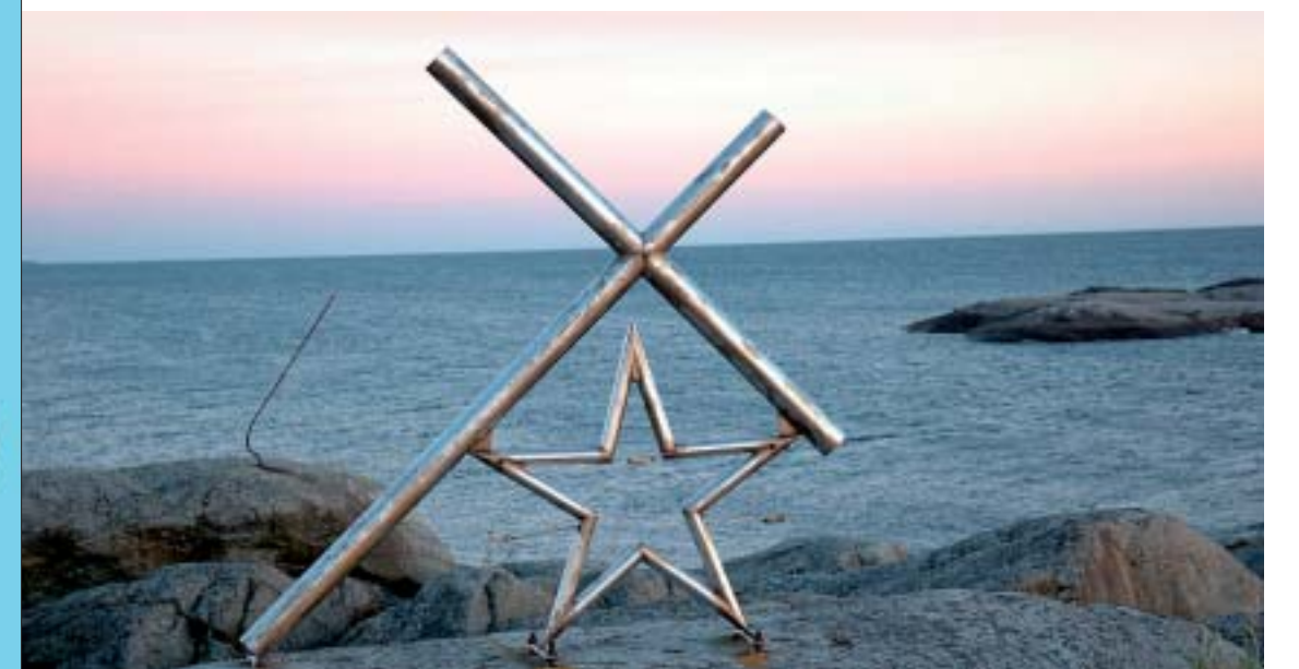
Sjärnan och Korset; till minnet av motorskonaren Drakens förlisning år 1929 Tähti ja Risti; muisto moottorikuunari Drakenin haaksirikosta vuonna 1929 Star and Cross, a memory of the shipwreck of the auxiliary schooner Draken in 1929.