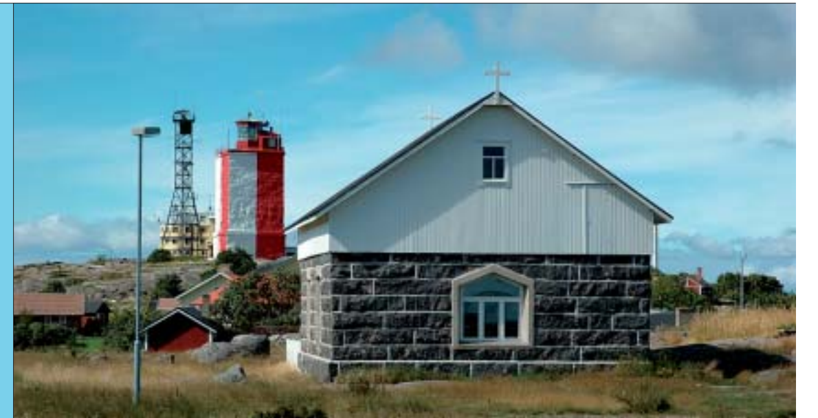
Utö Bönehus Utön Rukoushuone Utö Chapel